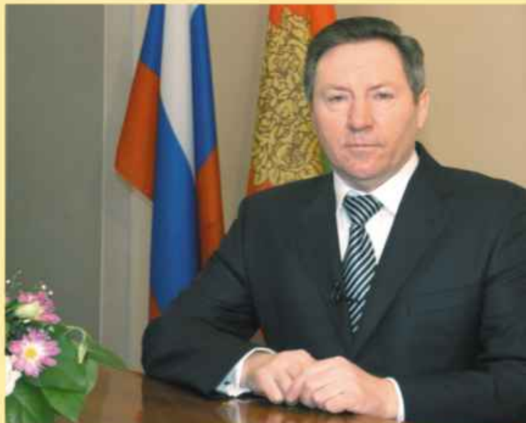
Глава администрации Липецкой области Олег Петрович Королев

позволят инвесторам быстро и недорого начать производство «с нуля», а квалифицированный персонал будет хорошим подспорьем в развитии и продвижении бизнеса как в России, так и за рубежом. Не менее важна и государственная поддержка, которая оказывается резидентам Индустриального парка в рамках областного законодательства.